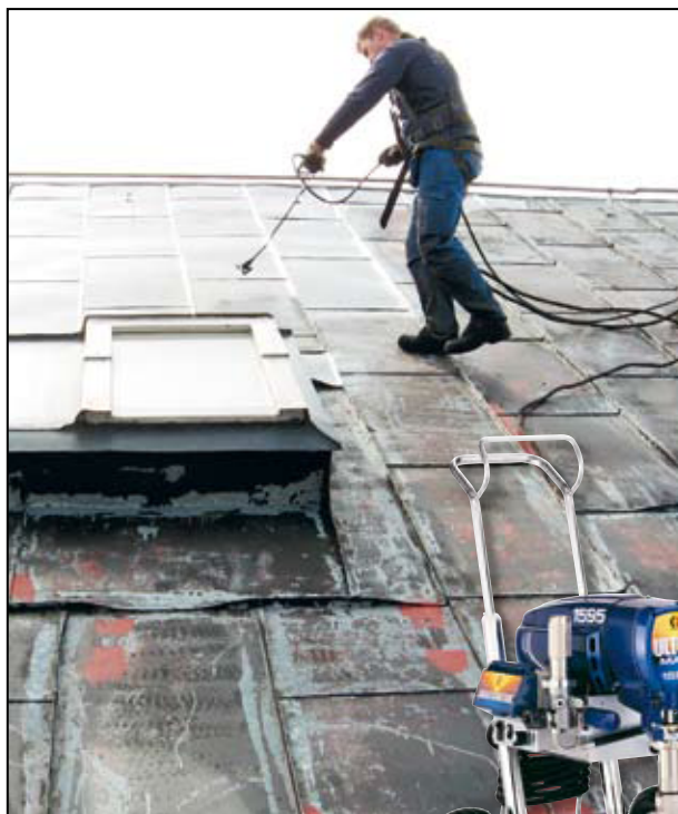
AquaBarria voidaan levittää ruiskulla, pensselillä tai telalla.