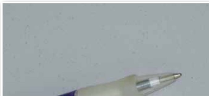
Hiekka 18V liukastumissuoja